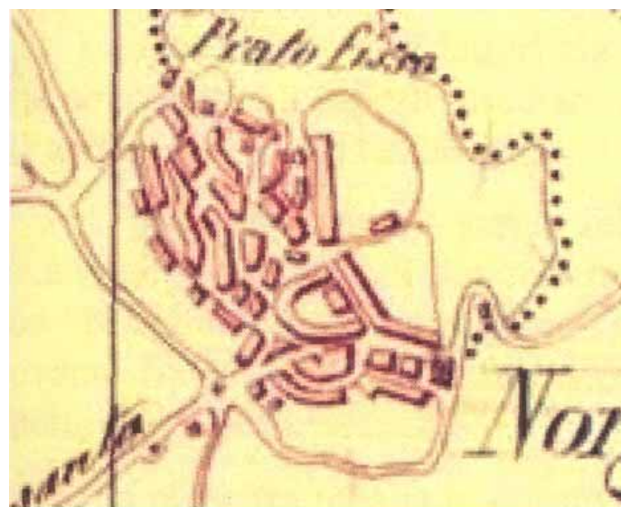
Stralcio dalla Cartografia De Candia 1847

Centro di antica e prima formazione del P.P.R. – verifica del perimetro del centro di antica e prima formazione a scala comunale – perimetro del centro storico nello strumento urbanistico vigente